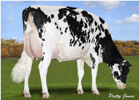
SILVERRIDGE DRMAN ALL FRANTIC DAM