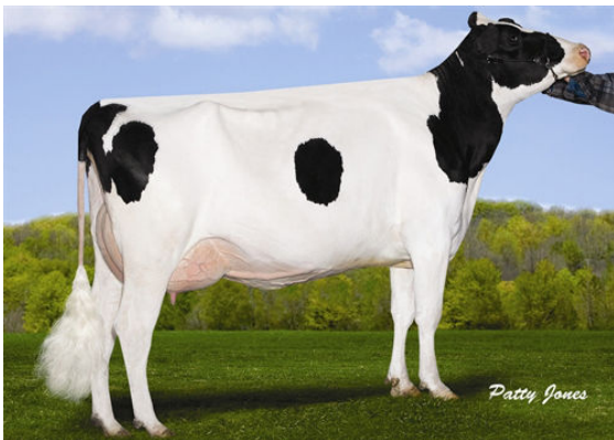
VELTHUIS PLANET ALBANY THIRD DAM