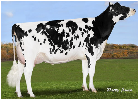
SILVERRIDGE DRMAN ALL FRANTIC DAM